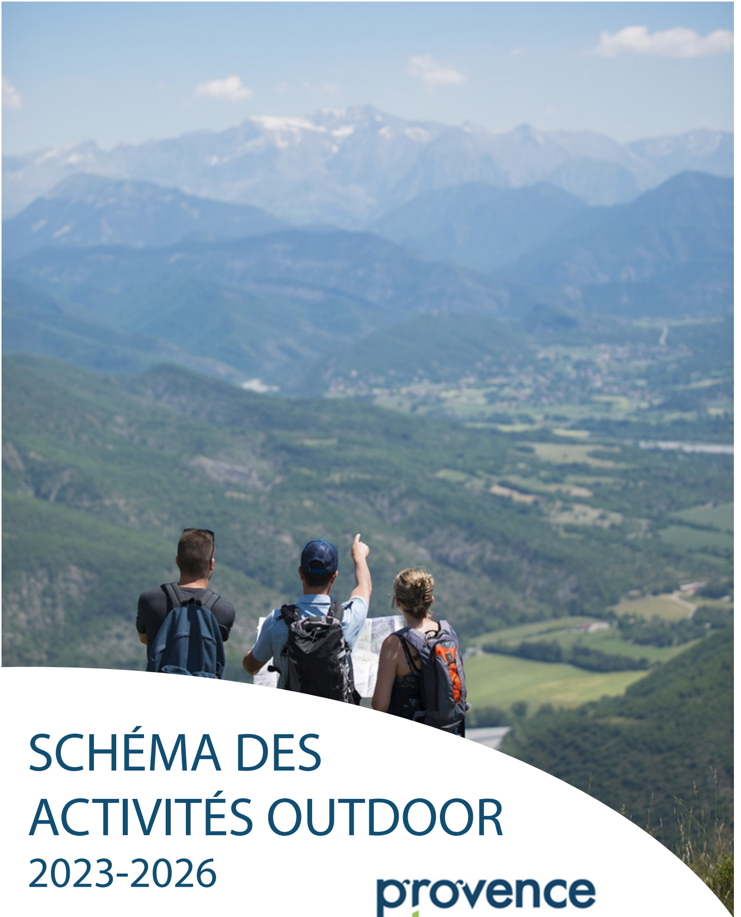
SCHÉMA DES ACTIVITÉS OUTDOOR 2023-2026