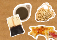
Restes de repas