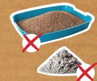
Litières et cendres